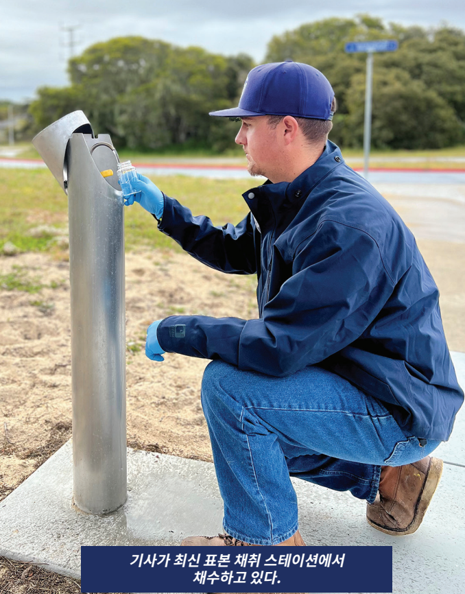
기사가 최신 표본 채취 스테이션에서 채수하고 있다.