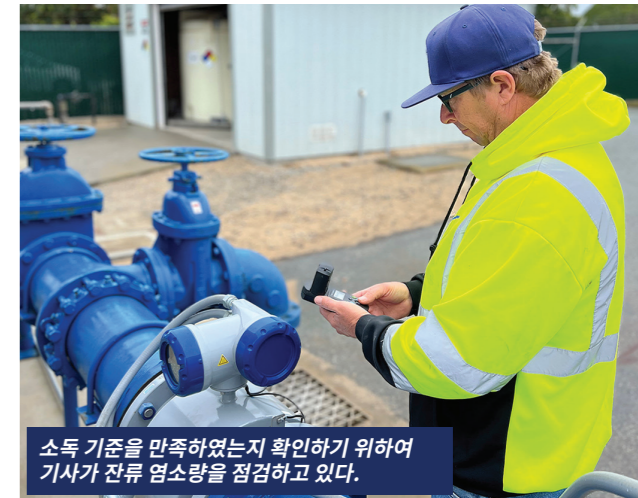
소독 기준을 만족하였는지 확인하기 위하여 기사가 잔류 염소량을 점검하고 있다.

합니다. 토양을 통해 주택에 침투한 라돈에 비하여, 수돗물에서 기화하여 침투한 라돈은 대개 실내 공기에 소량 존재할 것입니다. 라돈은 인체 발암 물질로 알려져 있습니다. 라돈에 오염된 공기 호흡 시 폐암을 유발할 수 있습니다. 라돈에 오염된 식수는 위암 위험을 증가시킬 수 있습니다. 가정 내 라돈에 대해 걱정되는 경우, 가정 내 공기를 검사하세요. 검사는 저렴하고 간단합니다. 실내 라돈 수치가 공기 1리터 당 4 피코퀴리(pCi/L) 이상인 경우, 가정 라돈 제거를 실시하여야 합니다. 저렴한 비용으로 라돈 문제를 간편하게 해결하는 여러 가지 방법이 있습니다. 자세한 정보를 보시려면, 캘리포니아 라돈 프로그램(1-800-745-7236)이나 미 환경국 안전한 식수 핫라인(1-800-426-4791) 또는 국가 안전 위원회 라돈 핫라인(1-800-767-7236)으로 전화하세요.