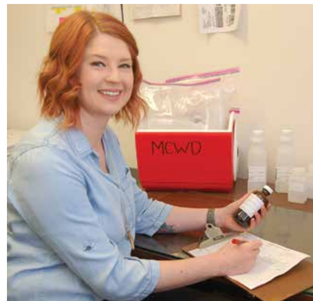
Chuẩn bị một mẫu nước để phân tích.

Radon là một loại khí phóng xạ mà bạn không thể nhìn, nếm hay ngửi. Nó được tìm thấy trên khắp Hoa Kỳ. Radon có thể di chuyển lên trên mặt đất và vào nhà thông qua các vết nứt và lỗ trên nền nhà. Radon có thể tăng đến hàm lượng cao ở tất cả các loại nhà. Radon cũng có thể đi vào trong nhà từ nước máy ở vòi hoa sen, máy rửa bát và các hoạt động trong gia đình khác. Trong hầu hết các trường hợp, radon đi vào nhà thông qua nước máy sẽ là một lượng nhỏ radon trong không khí trong nhà so với radon đi vào nhà thông qua đất. Radon là một chất gây ung thư ở người đã được biết đến. Hít thở không khí có chứa radon có thể dẫn đến ung thư phổi. Uống nước có chứa radon cũng có thể làm tăng nguy cơ ung thư dạ dày. Nếu bạn lo lắng về radon trong nhà, hãy