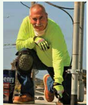
Bảo trì định kỳ tại Giếng 10.

Dự Án Dọn Dẹp Fort Ord: fortordcleanup.com